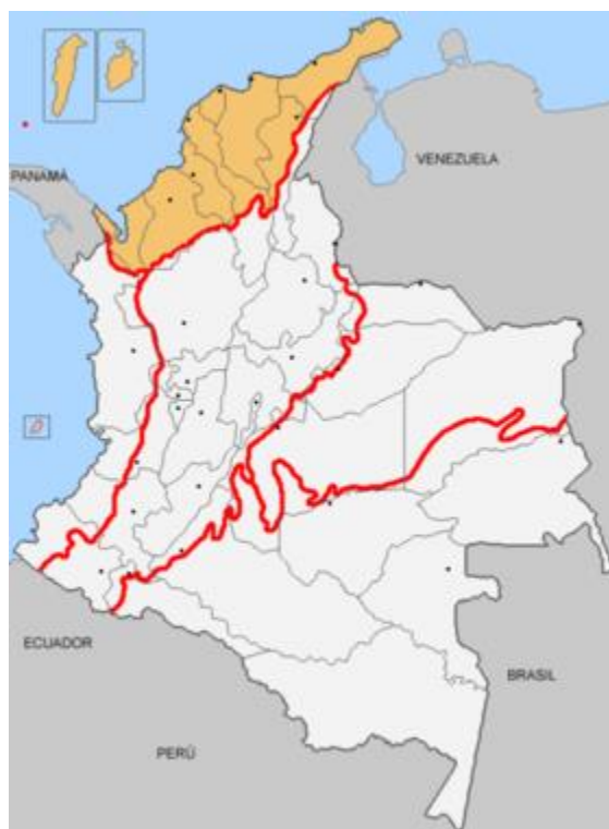
Ilustración 1. Ubicación geográfica